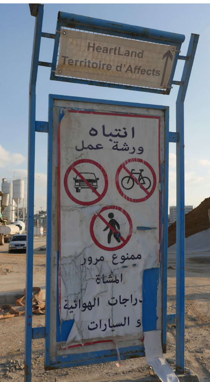
Dreamland, 2024 © Dominique Dalcan

Un voyage intime, une quête vers des origines, celles du Liban. De ce voyage est né le projet « Last Night A Woman Saved My life » de Dominique Dalcan.