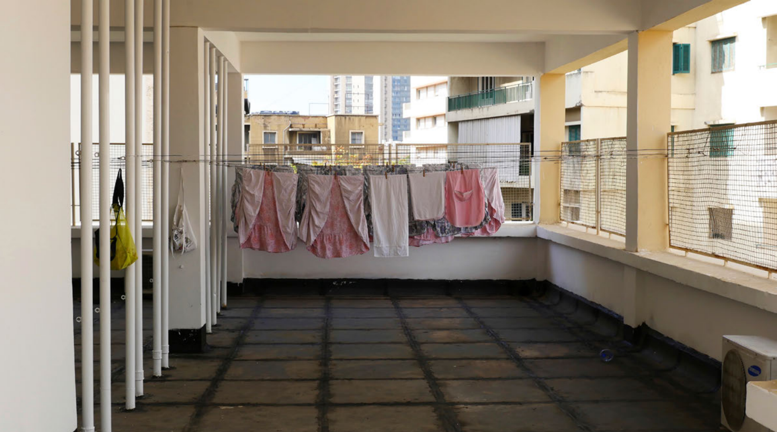
Sur le toit du monde, 2024 © Dominique Dalcan