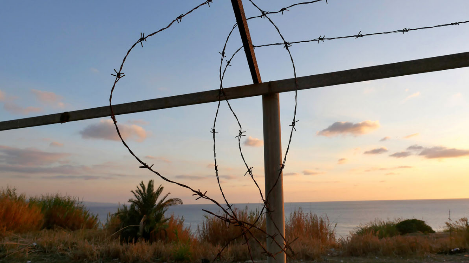
Point of view, 2024 © Dominique Dalcan